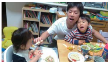
昨年の最優秀作品