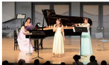
小さな子どもも楽しめます