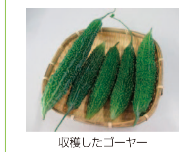
収穫したゴーヤー

市の取り組み グリーンカーテンプロジェクト 市では、平成28年度からグリーンカーテンの設置を続けており、今年度は、市役所とざまコミュニティプラザ(ふれあい会館)の南側でゴーヤーなどの栽培を行っています。 今年度栽培しているゴーヤーは、昨年度のプロジェクトで収穫したゴーヤーから種を採取して育てたもので、グリーンカーテンの植栽から収穫まで一連のサイクルが出来上がりました。 収穫したゴーヤーは、低炭素社会推進基金へ寄付をした市職員に配布し、同基金の一部は、今年度のプロジェクトに活用しています。同時に栽培したユウガオから採取した種は、市緑化祭りで寄付をいただいた市民に配布しました。 また、公共施設へグリーンカーテン用物品を貸し出し、グリーンカーテン設置をサポートしています。