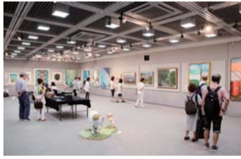
多彩なジャンルの作品が並びます