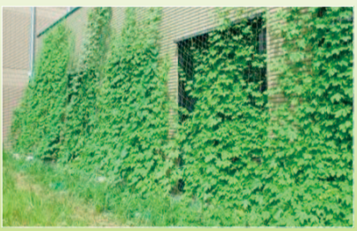
市役所に設置したグリーンカーテン

グリーンカーテンとは、ツルレイシ(ゴーヤー)やアサガオなどツル性植物を窓の外や壁に張ったネットなどに這わせて栽培したものです。茂った葉が直射日光を遮る「遮断効果」と植物が根から吸った水分を蒸発させ周囲の熱を奪う「蒸散作用」で室温を下げ、エアコンなどの冷房機器の使用を抑えることができます。