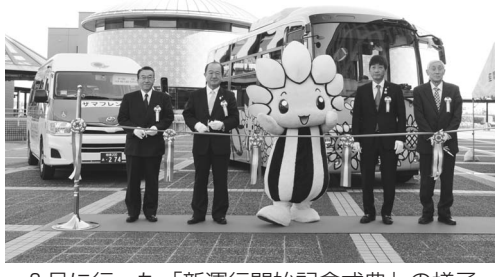
2月に行った「新運行開始記念式典」の様子