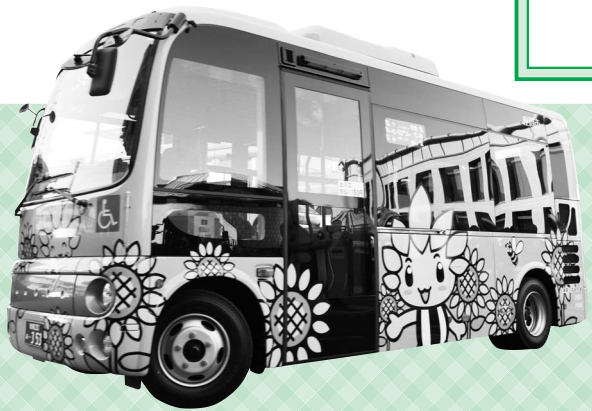
2月1日から下図C（栗原小池経由）小松原・相模が丘循環左回りコースを運行している、市マスコットキャラクター「ざまりん」をラッピングした小型バス

市では、時刻表を掲載した「運行利用案内」を配布していますのでご利用ください（市ホームページからダウンロード可）。 ○配布場所 市役所4階都市計画課・1階市民情報コーナー、市民館、北・東地区文化センター、各出張所など