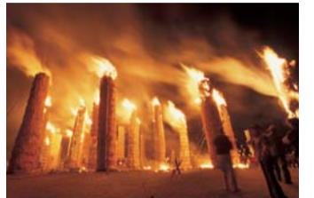
大迫力の松明あかし

○問い合わせ先 須賀川市松明あかし実行委員会（須賀川観光協会内）☎0248(88)9144