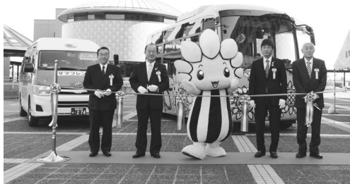
2月に行った「新運行開始記念式典」の様子