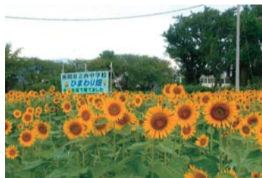
西中学校近くのひまわり畑

書道を教えるために訪れた介護施設で、参加者が「テレビで座間市のひまわり畑が紹介されていましたよ」と教えてくれました。「私の住む座間市は、全国に向けて紹介されるすばらしい街なのだ」と思いました。8月も終わりが近づき、いつもの土手に涼風が吹き始め「今年のヒマワリはもう終わりがかな」と思っていた帰り道、西中学校のすぐ近くで満開に咲き誇るひまわり畑に出会い、うれしい気持ちでいっぱいになりました。後でこのひまわり畑は、同校の生徒が始業式に合わせて育てたものだと聞きました。若い力に感心すると同時に、私に元気をくれたひまわり畑に心の中で「ありがとう」と伝えました。