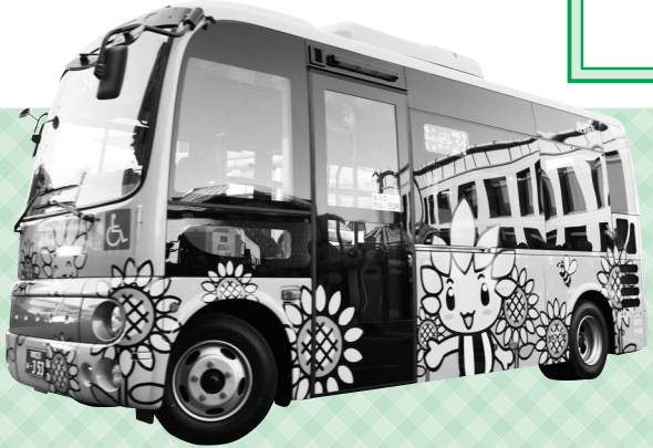
2月1日から下図C（栗原小池経由）小松原・相模が丘循環左回りコースを運行している、市マスコットキャラクター「ざまりん」をラッピングした小型バス

市では、時刻表を掲載した「運行利用案内」を配布していますのでご利用ください（市ホームページからダウンロード可）。 ○配布場所 市役所4階都市計画課・1階市民情報コーナー、市民館、北・東地区文化センター、各出張所など