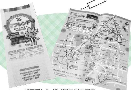
ザマフレンド号運行利用案内

悪天候などにより運行が中止となる場合は「座間市緊急情報いさまメール」でお知らせする他、運行状況に関する問い合わせ先や担当でもご確認できます。 ○運行に関する問い合わせ先 神奈川中央交通株式会社大和営業所 ☎046(274)3239 ※「座間市緊急情報いさまメール」については、危機管理課☎046(252)7395へお問い合わせください。