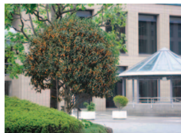
ふれあい広場に咲く市の木モクセイの花