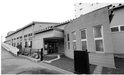
リサイクルプラザ

険料も、若年者の皆さんの負担も増えていきます。高齢化が進む中、医療保険制度を維持していくには医療費の抑制が必要です。生涯を通じて、健康に気を付けて、生き生きと暮らすことが、何よりも自分自身のためになり、社会のためにもなります。