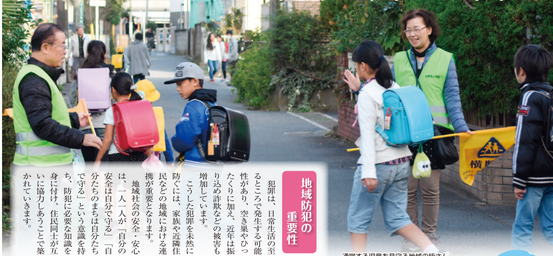
通学する児童を見守る地域の皆さん