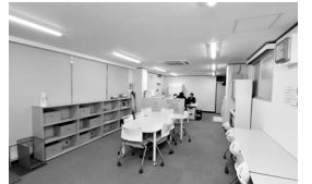
落ち着いた雰囲気 の施設です