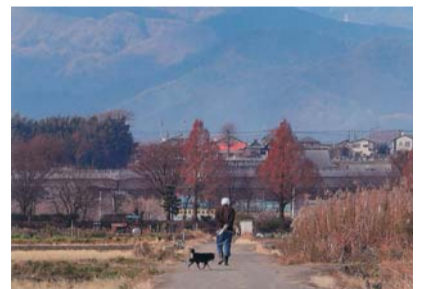
最優秀作品「散歩道」

○内容 市内を撮影したものまたは市内から撮影したものの中から最優秀作品他15人の入賞・入選作品などを展示