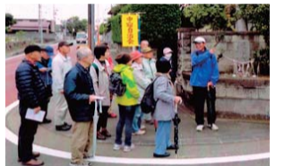
市民レクでの「歴史散策」

中宿（東、中、西）自治会は、北は上宿、南は下宿自治会に接し、東は座間公園、西はJR相模線に囲まれた自治会です。中宿自治会の中央を南北に県道が走っており、東側を東部および中部自治会とし、西側を西部自治会と三つに分けて活動しています。現在280世帯規模の自治会です。毎年の主な活動は、盆踊り、不動尊祭典、市民レク、美化デー、安全安心パトロール、どんど焼きなどで、行事を通じ、会員相互の交流を図っています。座間神社の春・夏の例大祭に実施する「奉納太鼓」は、子ども会とその後援会が活動を推進しています。今後の取り組みとしては「災害時にどう備えれば良いのか」その活動の進め方について検討を始めたところです。