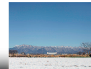
丹沢連峰を望む四ツ谷の雪 景色(写真は昨年のも)