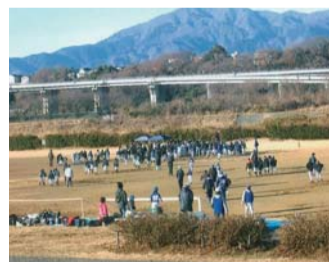
相模川グラウンドに集合する少年たち

太陽の光を体いっぱい浴びて元気いっぱい走り、スポーツを楽しんでいる少年たちはとても活力に満ちていて、とても感動しました。 最近、幅広い世代の方がジョギングを楽しんでいる姿をよく見掛けるようになり、座間市民の健康意識が高くなっているように感じています。 スポーツは体力だけでなく豊かな心を育んでくれます。皆さんもスポーツを通して健康な心と体づくりをしてみたいかがでしょうか。