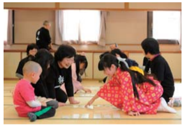
サークル活動の様子