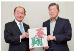
凧文字「葵翔」を掲げて

応募総数30点の中から選ばれた「葵翔」には、「市の花ヒマワリ（向日葵）の知名度が日本中に広がり、市の繁栄を願って大空高く舞い上がってほしい」という意味が込められています。