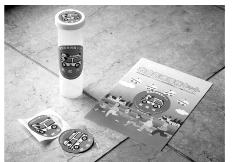
配布している救急医療情報キット

市では、救急時に救急隊員が医療情報を確認できるように「かかりつけ医」「薬剤情報」「持病」などの医療情報を専用の容器に入れ、自宅の冷蔵庫に保管するための「救急医療情報キット」を無料で配布しています。