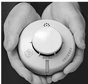
住宅用火災警報器

消防署の職員が住宅用火災警報器などの物品を販売することはありません。ご注意ください。