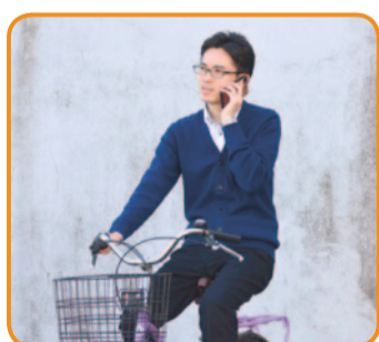
電話しながら運転

自転車運転者講習 自転車運転の危険行為で3年以内に2回以上摘発されると「自転車運転者講習」の受講が命じられます。受講には手数料がかかり、命令に従わないと5万円以下の罰金刑に処せられます。