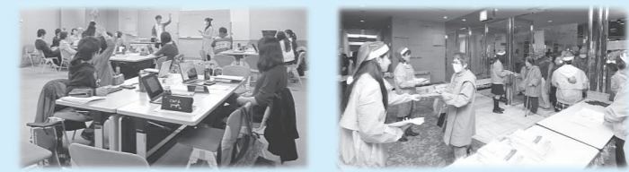
▲グループ研修 ▲ボランティア活動

座間市と国際姉妹都市「スマーナ市」の架け橋となるための活動を行います。座間市やスマーナ市のことを勉強して（研修）、国際親善大使の仲間たちとスマーナ市でホームステイをしながら、勉強した成果を発表したり（派遣）、逆にスマーナ市から来る中学・高校生のホストファミリー（ホームステイをする学生を受け入れ、世話をする家族）になって座間市を紹介したり（受入）するなど、たくさんの貴重な体験ができます。活動期間は3年間です。