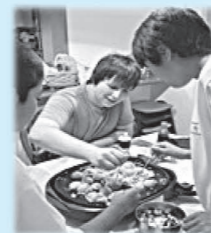
▲ホストファミリー（国際親善大使とその家族）と一緒に夕食