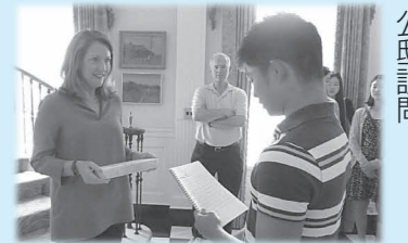
◀テネシー州知事公邸訪問

「座間フェア」の開催や現地の学校体験、テネシー州知事公邸訪問、観光地巡りなど、思い出に残る貴重な体験が盛りだくさんです。また、滞在中はホストファミリーの家でホームステイをするので、現地の生活を体験できます。