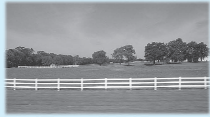
▲スマーナ市郊外の風景

スマーナ市は、夏は気温が高く、冬には雪が降り、緑豊かな美しい街です。農業が盛んで、小麦、大豆、トウモロコシや大豆の栽培が盛んです。また、座間市と同じく、自動車工場があり、産業の支えとなっています。