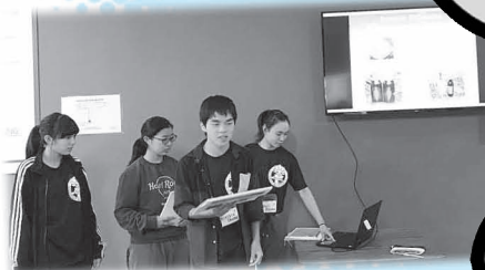
「座間フェア」で座間市を紹介