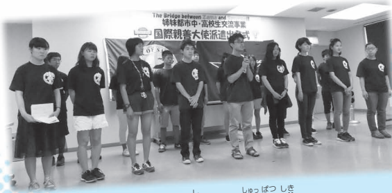
スマーナ市への出発式