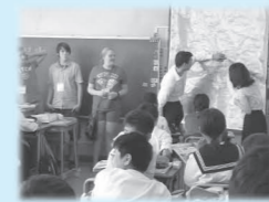
◀日本（座間市）の学校体験