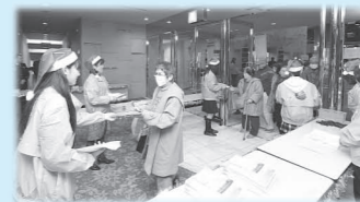
▲ボランティア活動