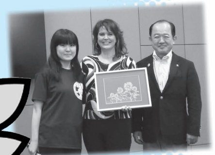
スマーナ市長(中央)と座間市長と一緒に