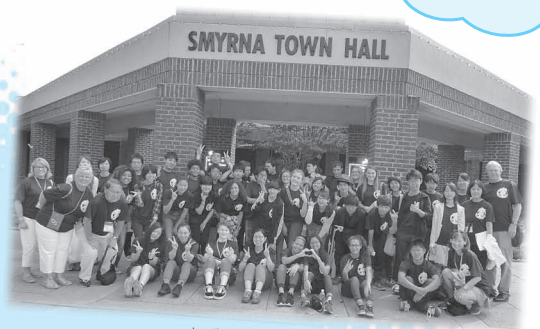
スマーナ市役所前での集合写真