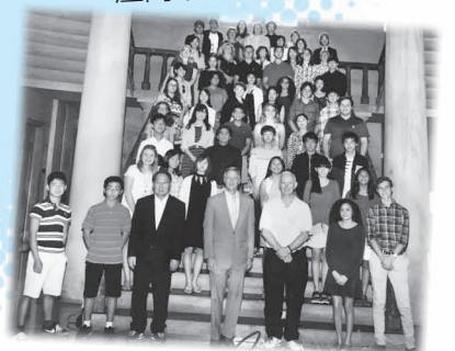
テネシー州知事(前列中央)と記念撮影