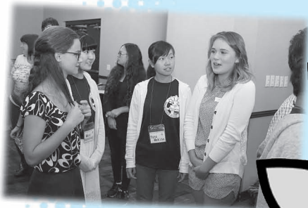
スマーナ市の友だちと仲良く会話中