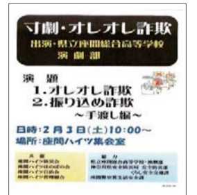
近隣住宅に配布したチラシ

東建座間ハイツ自治会では、近年多発する「振り込め詐欺」の犯罪防止に対し、県安全防災部から安全交通課の協力を得て、高齢者を対象に「振り込め詐欺」の寸劇による防犯講座を今年2回開催しました。特に、2回目の講座では、「座間総合高等学校演劇部」による防犯講座を2月3日に開催しました。演劇部の生徒は、県安全防災部から安全交通課の監修の下、昨年10月頃から練習し、大変面白く分かりやすい寸劇に仕上げ臨んでくれました。当日は、東建座間ハイツ・近隣住民合わせて59人の住民が聴講し、息子や警察、市職員などに成り済ました犯人が言葉巧みに現金や通帳をだまし取る手口を学びました。