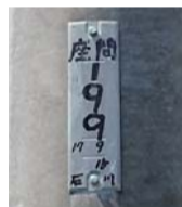
電柱に掲示された管理番号

市内などからの119番通報を受け付ける「海老名市・座間市・綾瀬市消防指令センター」では、東京電力が所有する電柱の管理番号から位置を特定できる、位置検索システム「アットサーチ」を導入しました。火事や救急で119番通報をする際に、消防車や救急車が向かう場所の「住所が分からない」「目標や目印となるものがない」などの場合には、電柱へ掲示された管理番号を伝えてください。