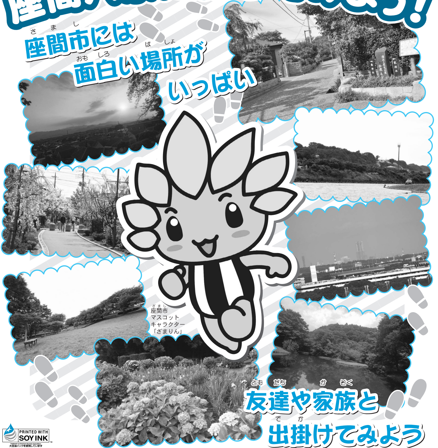
ざ ま し 座間市 マスコット キャラクター 「ざまりん」