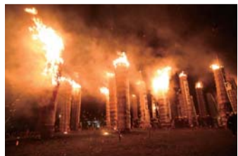
大迫力の松明あかし

最大で高さが10メートルある大松明に火が付けられるこの祭りは、420年以上の歴史がある伝統行事で、日本三大火祭りに数えられます。