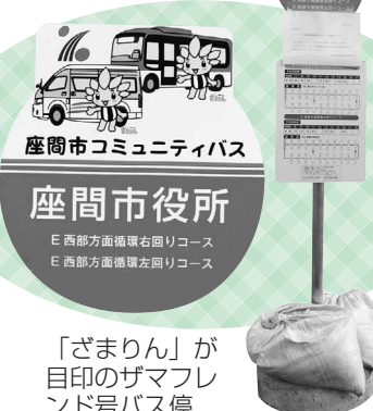
「ざまりん」が目印のザマフレンド号バス停