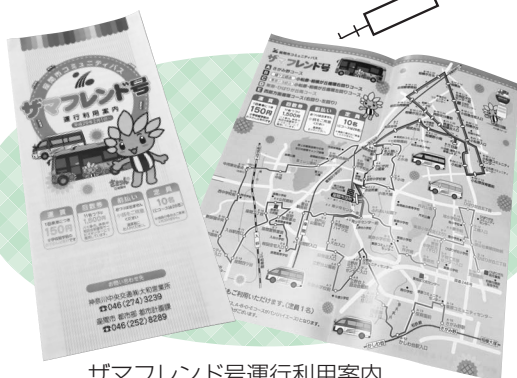
ザマフレンド号運行利用案内

悪天候などにより運行が中止となる場合は「座間市緊急情報いさまメール」でお知らせする他、運行状況に関する問い合わせ先や担当でもご確認できます。 ○運行状況に関する問い合わせ先 神奈川中央交通株式会社大和営業所 ☎046(274)3239 ※「座間市緊急情報いさまメール」については、危機管理課☎046(252)7395へお問い合わせください。