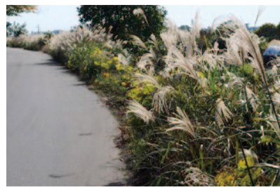
相模川沿いのススキ