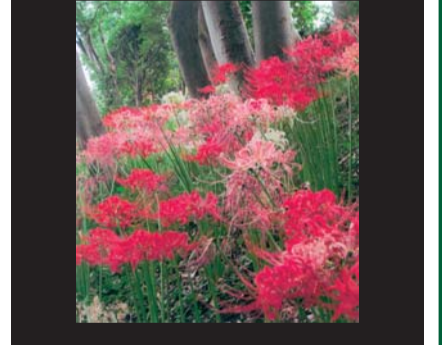
依田 節子 平成29年9月23日撮影 かみが沢公園