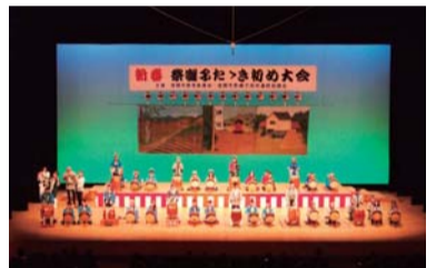
全団体合同の演技