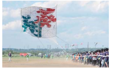
昨年の凧文字「葵翔」

5月4日（土）・5日（日）に開催する座間市大凧まつりで掲揚する13メートル四方の大凧に書き込む凧文字は、4月1日（月）以降に発表予定の「新元号」に決まりました。そのため、例年行っている、凧文字の公募は行いません。皠月の空を舞う大凧をご期待ください。