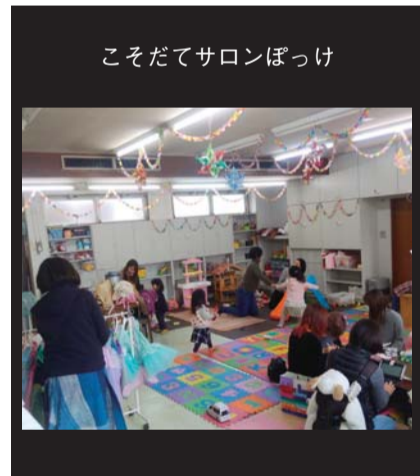
こそだてサロンぽっけ