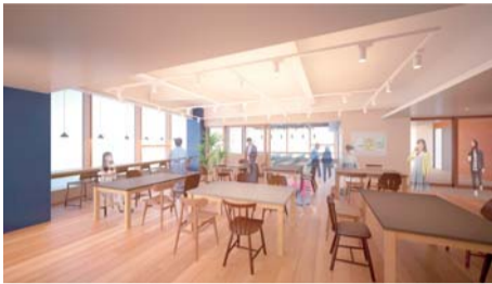
市民交流プラザイメージ図

市では、多世代交流などを目的とした「市民交流プラザ」を、12月に小田急相模原駅前に開設する予定です。利用者に親しまれる施設となるよう愛称を募集します。