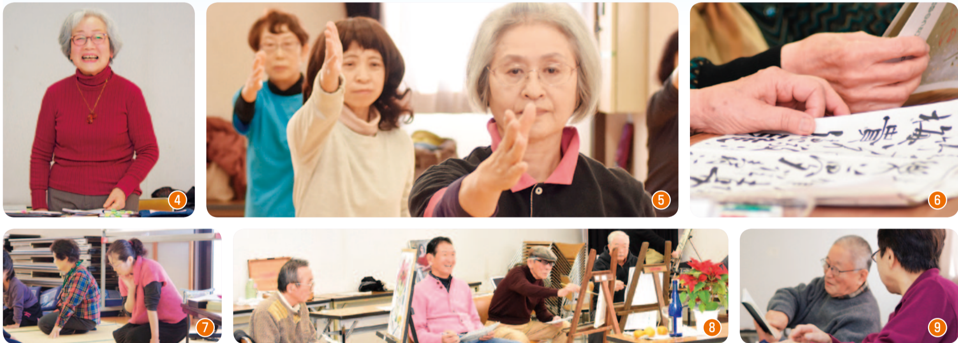
①⑥書道サークル ②合唱サークル ③⑤太極拳サークル ④⑨詩吟サークル ⑦競技かるたサークル ⑧油絵サークル