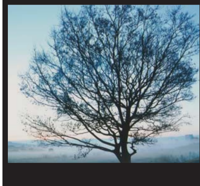
吉田 もとひろ 平成24年1月16日撮影 新田宿