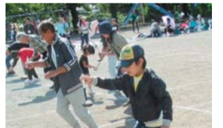
市民レクでのスプーンレース

小池地区は、目久尻川が南北に流れ、木々の緑などが残る地域です。目久尻川の源流は、かつて白髪辨財天社の前にあった小さい池（湧水）で、地名の由来でもあります。