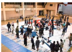
協力して文字書きをする様子

○申込方法 4月5日（金）までに氏名、年齢、連絡先（電話番号、ファクスまたはメールアドレス）を電話またはファクスで担当へ