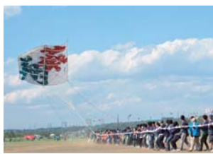
大迫力の大風を引き揚げます

○申込方法 4月19日（金）までに氏名、年齢、連絡先（電話番号、ファクスまたはメールアドレス）を電話またはファクスで担当へ