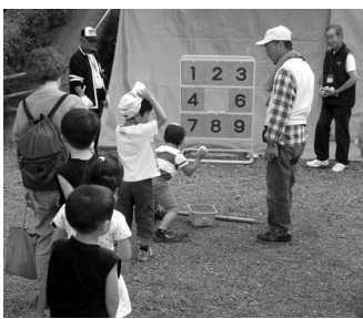
市民レクリエーション

また、回覧物や掲示物によって地域・行政情報を提供したり、イベントの開催などを通じて、住民同士の親睦・交流を深めたり、住みよい地域づくりにも取り組んでいます。