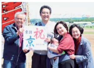
ミニ凧を受け取り初節句を祝う家族

○受取方法 当選はがきと代金を5月4日（土）・5日（日）午前10時～午後3時に、大風まつり会場（座架依橋北側）本部隣の受け渡しテントへ持参