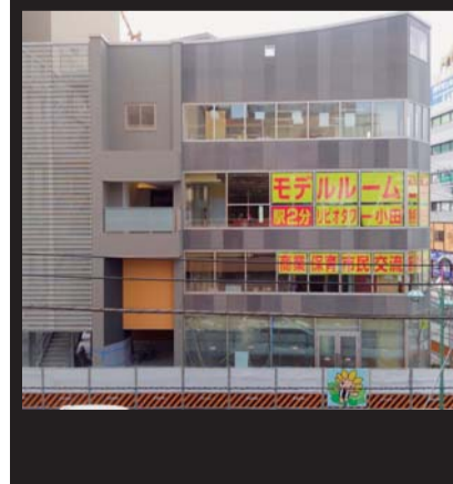
福島 芳枝 平31年2月14日撮影 相模が丘