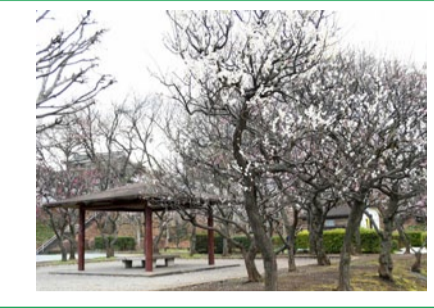
かにが沢公園を彩るウメ