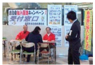
加入促進キャンペーンの窓口対応

市自治会総連合会（市自連）には179の単位自治会があり、餅つきやどんど焼きといった行事やゴミ集積所の管理、募金の取り扱い、回覧板での情報伝達など地域生活に関わるさまざまな活動を行っています。市自連は自治会活動の支援や情報発信の役割を担っており、その運営は13ある地区自治会連合会から選出された代表者が理事や役員の役職であり、3月18日（月）から23日（土）までは市役所1階市民ホールで自治会加入促進キャンペーンを行います。4月には市自連ホームページをリニューアルし、エクセルの会計システムや一時集合場所ポスターのひな型など自治会の活動に役立つツールがトップページからすぐに分かるように工夫しました。