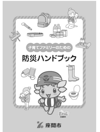
防災ハンドブック