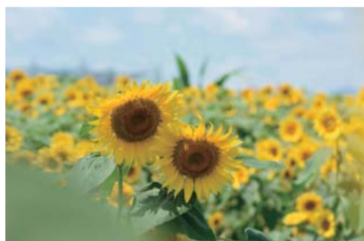
コンパクトカメラやスマートフォンで撮影した作品で応募可