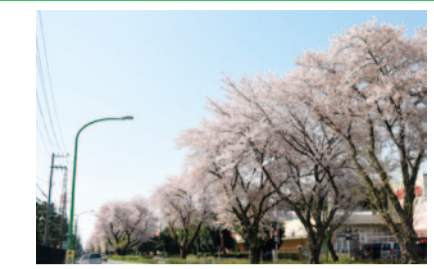
東原桜並木のサクラ