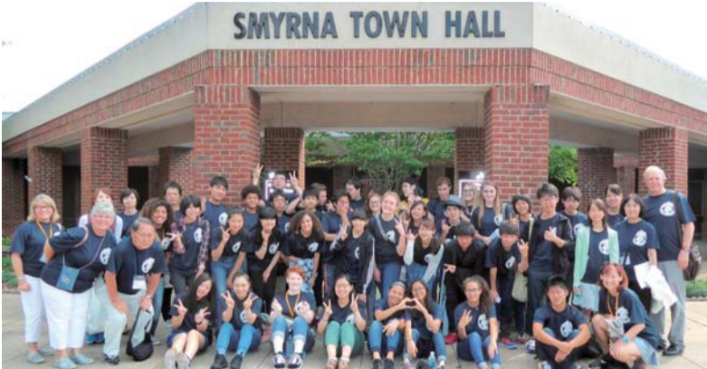
スマーナ市での交流の様子

姉妹都市米国テネシー州スマーナ市の生徒と交流し、両市のPRを行う座間市国際親善大使を募集します。