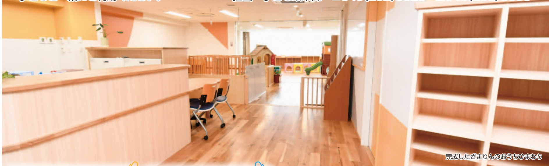
完成したざまりんのおうちひまわり

同センターは、遊具の揃ったプレイルームやほふく室の他、授乳室・おむつ替え室、相談や育児情報の収集などができる相談室などの設備を整えており、子育て中の親子同士で交流を深めながら自由に過ごすことができます。ぜひ、子どもと一緒にご利用ください。 担当 子ども政策課 ☎046(252)8025 ☎046(255)5080