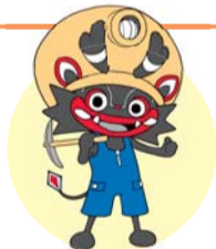
大牟田市公式キャラクター「ジャー坊」

チャレンジデーの対戦自治体が「福岡県大牟田市」に決定しました。大牟田市の人口は115,281人（1月1日現在）で、チャレンジデーの成績は7勝7敗です。 ※市の人口は129,912人（1月1日現在）で、成績は1勝3敗です。