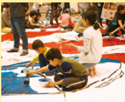
今年の文字書きの様子