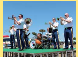
在日米陸軍軍楽隊