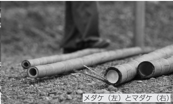
メダケ (左) とメダケ (右)