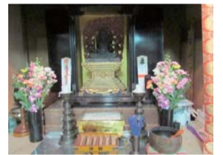
中宿のお不動さん

中宿自治会の自治会館は江戸時代初期に建立されたお寺の跡地にあります。地域では廃寺になった後も本尊の「不動明王」を祀り、毎月の不動講や秋の祭典を行い「お不動さん」と呼び地域の守り神として親しまれています。自治会加入率は90パーセントを超えているものの、新規入居者の加入割合は低いなど、課題は山積していますが、諸先輩が守ってきた伝統を生かしつつ、新しい味付けを試みながら楽しい自治会を目指し頑張っています。