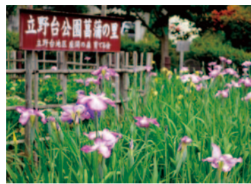
立野台公園に咲くハナシロウ ※写真は昨年のものです。

市の人口●130,263人(+103人) 市の世帯数●58,951世帯(+173世帯) 令和元年5月1日現在( )は平成31年4月との増減