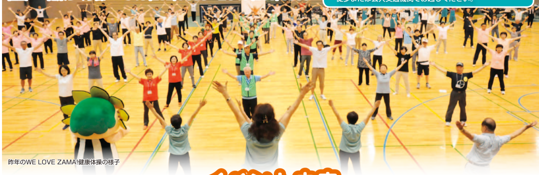
昨年のWE LOVE ZAMA!健康体操の様子