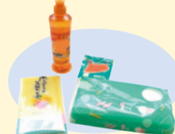
キッチングッズ・洗濯用洗剤

室内用のペタン クボールを3回投 球し、100点以上で 賞品をプレゼントします。