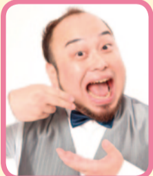
アホマイルド坂本