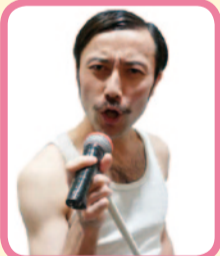
スペリー・マーキュリー