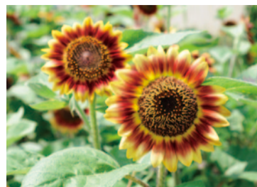
東原コミュニティセンター 横の赤いヒマワリ ※写真は昨年のものです。