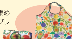
折り畳めるエコバッグ