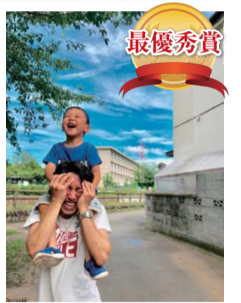
昨年の最優秀作品

市男女共同参画推進委員会では、例年大好評の育児を楽しむ父親（イクメン）・祖父（イクジイ）や家事に積極的に取り組む男性（カジ男）を撮影した「イ・イ・男フォトコン2019 IN ZAMA」の写真作品を募集します。入選作品は情報紙「あくしゅ」に掲載します。詳しくは、市ホームページ（または、二次元バーコード）をご覧ください。