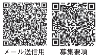
メール送信用 募集要項

担当 広聴人権課 ☎046(252)8087 ☎046(252)0220 jinken@city.zama.kanagawa.jp