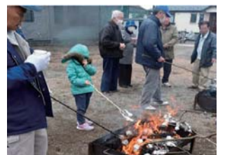
平成31年のどんど焼き

星の谷西自治会は星の谷第一自治会と共催で親睦・交流の輪を広めるべく近隣自治会にも声掛けし、どんど焼きを実施しています。今年に入りどんど焼きに必要な道祖神を移設しなければいけない状況となり、近隣自治会など皆で頭をひねり、地主さんのご厚意もあり無事移設できました。地域に根付いた身近な文化の継承も自治会の役目と感じつつ、令和最初のどんど焼きも無事開催できると安堵しております。