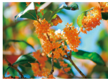
ハイモニーホール座間西側に咲く市の木モクセイの花