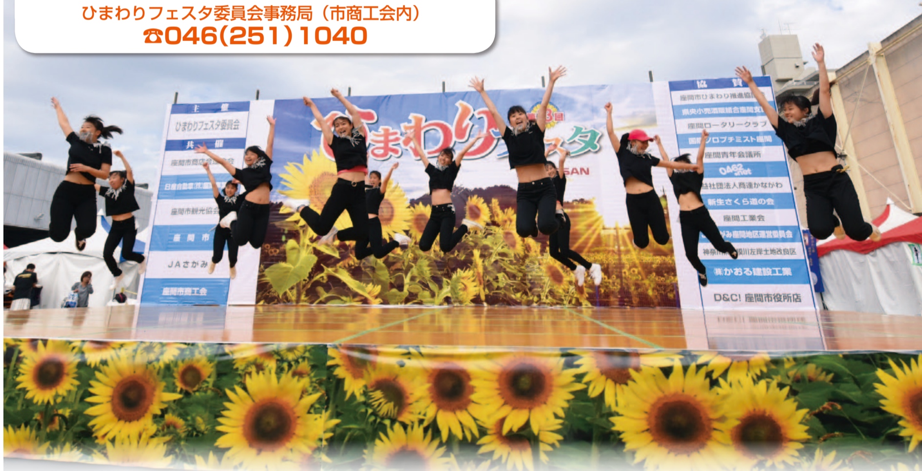
昨年のステージの様子