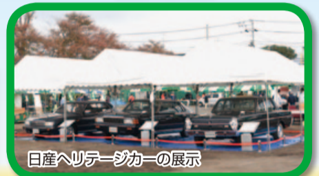
日産ヘリテージカーの展示

担当 座間市民ふるさとまつり実行委員会事務局(市民協働課内) ☎046(252)7966 FAX046(255)3550