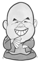
夢見亭わっぱさん