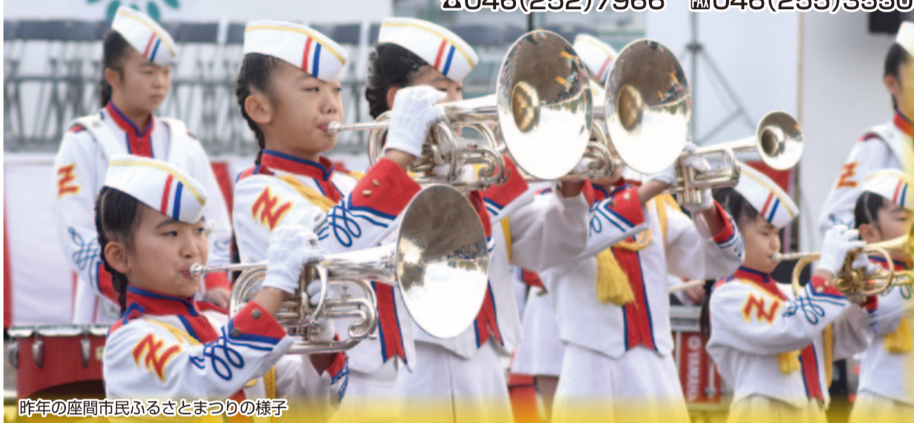
昨年の座間市民ふるさとまつりの様子