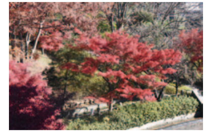
大坂台公園のモミジ