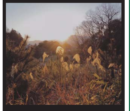
苗村 のぞみ 平成31年2月20日 県立座間谷戸山公園