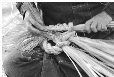
過去の教室の様子