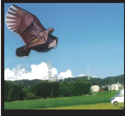
稲葉 勝子 令和元年9月6日 相模川周辺