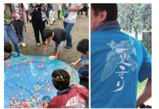
真剣集中の子ども達と新作Tシャツ

7月13日4自治会合同夏祭りが開催されました。今年は祭り用Tシャツも出来上がり気合満々。しかし梅雨のさなかの開催に当自治会は連日天気予報を気にしながらカキ氷用の氷発注数を悩む日々でした。当日の天気予報曇りに安堵したにもかかわらず昼過ぎには雨が……。客足を心配しましたが思った以上に来場いただき、雨に濡れながらもお祭りを盛り上げてくれた皆さんに感謝、感謝で全プログラムを終えることができました。