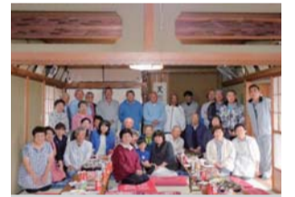
ウォーキング懇親会

中河原地区は市の北西部に位置しております。緑豊かな田園風景が広がり遠くに丹沢山系を望むことが出来ます。毎年5月に行われる大風祭りや、8月のひまわりまつりも近くで催され、まつりの時期になると畑一面が黄金色に覆われます。100人余りの集落ですが、昔からの住民が多いため、顔なじみの人が殆どです。そのような地域の特性から、自然と自治会への加入意識も強く、自治会加入率100%を維持しております。