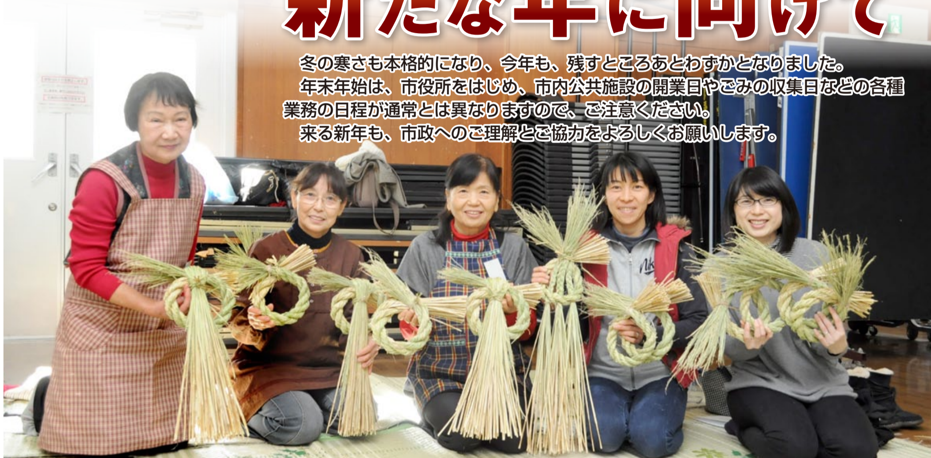
例年、市公民館などで開催するしめ飾り教室(過去の様子)。手作りのしめ飾りで新年を迎えます

冬の寒さも本格的になり、今年も、残すところあとわずかとなりました。年末年始は、市役所をはじめ、市内公共施設の開業目やごみの収集目などの各種業務の日程が通常とは異なりますので、ご注意ください。来る新年も、市政へのご理解とご協力をよろしく申し上げます。