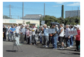
防災・避難所開設訓練の参加者

関東大震災から約100年、巨大地震は南関東にいつ起きてもおかしくないと言われていいます。南栗原地区自連は、昨年6月に市危機管理課・消防本部・地元消防団・南中学校の協力を受け、消火・煙体験・救命・飲料水貯水槽からの給水・炊き出し体験と防災備蓄倉庫の備品確認等の防災訓練・避難所開設訓練を行いました。これらは必ずいざという時に役立つと思います。備えあれば憂いなし。自治会でみなさん一緒に活動しましょう。