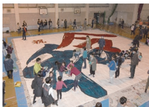
協力して文字書きをする様子