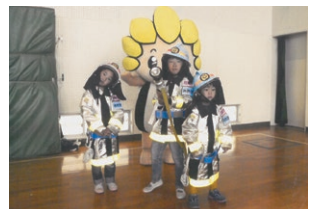
防火服を着て出動準備よし

令和元年10月27日（日）に運動会形式の市民レクリエーション大会を旭小学校体育館で行いました。最終競技には、三人の子たちが消防本部から借りた子ども用防火服を着せてもらい参加しました。着替えて出動した可愛い小さな消防士の姿に会場していた「ぞまりん」からもがんばれの応援があり、240人程の参加者は大変盛り上がりました。大会実施にあたり、ご協力を頂きました旭小学校と消防団に心から感謝申し上げます。