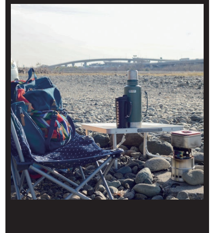
お手軽デイキャンプ