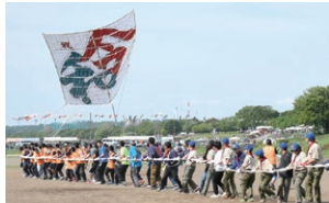
力を合わせて大風を引き揚げます