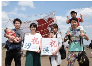
ミニ凧を受け取り初節句を祝う家族

○受取方法 当選はがきと代金を5月4日（月）・5日（火）午前10時～午後3時に、大風まつり会場（座架依橋北側）本部隣の受け渡しテントへ持参