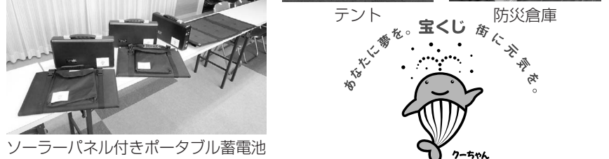
ソーラーパネル付きポータブル蓄電池