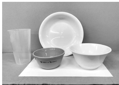
貸し出しする食器