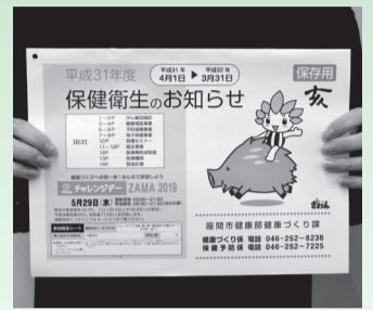
保健衛生のお知らせ (写真は昨年のもので)

同冊子には、成人検診、予防接種、母子事業、健康づくり、衛生事業など、市の保健衛生事業に関わる情報を掲載していますので、大切に保管してください。 なお、以下の場所でも配布しますので、紛失の際などにご利用ください。 ○配布場所 市役所2階健康づくり課・1階市民情報コーナー、各出張所、市民健康センター