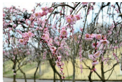
かにが沢公園のウメ