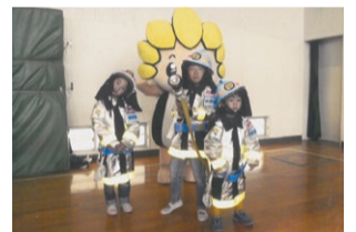
防火服を着て出動準備よし

令和元年10月27日（日）に運動会形式の市民レクリエーション大会を旭小学校体育館で行いました。最終競技には、三人の子たちが消防本部から借りた子ども用防火服を着せてもらい参加しました。着替えて出動した可愛い小さな消防士の姿に会場していた「ごまりん」からもがんばれの応援があり、240人程の参加者は大変盛り上がりました。大会実施にあたり、ご協力を頂きました旭小学校と消防団に心から感謝申し上げます。