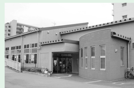
リサイクルプラザ