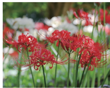
かにが沢公園のヒガンバナ (写真は昨年のものです)

新型コロナウイルス感染症拡大防止のため、従来の対面による調査は原則行いません。インターネットや郵送による回答にご協力ください。