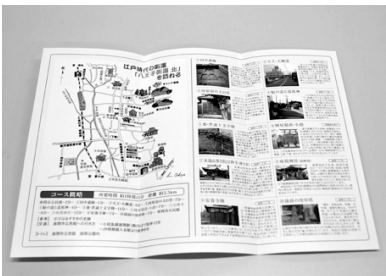
写真とイラストでコースを紹介