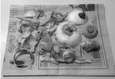
ジャガイモの皮、レタスの芯、ニンジンなどの皮などを新聞紙の上で1日乾かしたところ、水分が抜け、約4割重量が軽くなりました。

肥化する「電動式生ごみ処理機」や「生ごみ堆肥化容器」への購入補助制度を設けています。詳しくは担当へお問い合わせください。