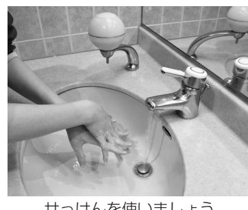
せっけんを使いましょう

○対象 市内在住で、住民登録のある人が所有し、自ら居住している住宅(共同住宅は専有部分、併用住宅は住宅部分)で、工事費が10万円以上(税抜き)