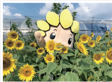
ヒカリファーム（座間1丁目）