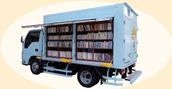
市内を巡回する「ひまわり号」

約1,500冊の本を積載して市内を巡回する移動図書館「ひまわり号」を運行しています。ひまわり号では、大人向けから子ども向けまで幅広い書籍を用意しています。また、本の貸し出しの他、図書館、図書室共通の「貸出券」を作ることができ、初めての方でも気軽に本を借りることができます。ひまわり号の巡回コースや日程は、広報ざま9月1日号の他、図書館ホームページから確認できます。 ※貸出券を作ることができる対象や必要書類は図書館ホームページまたは担当へお問い合わせください。