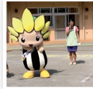
ひばりが丘幼稚園の運動会の練習

幼稚園の運動会の練習や、小学校の座間市を学ぶ授業にざまりんも参加してきたよ。みんなと会えて楽しかったな！