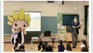
中原小学校での授業