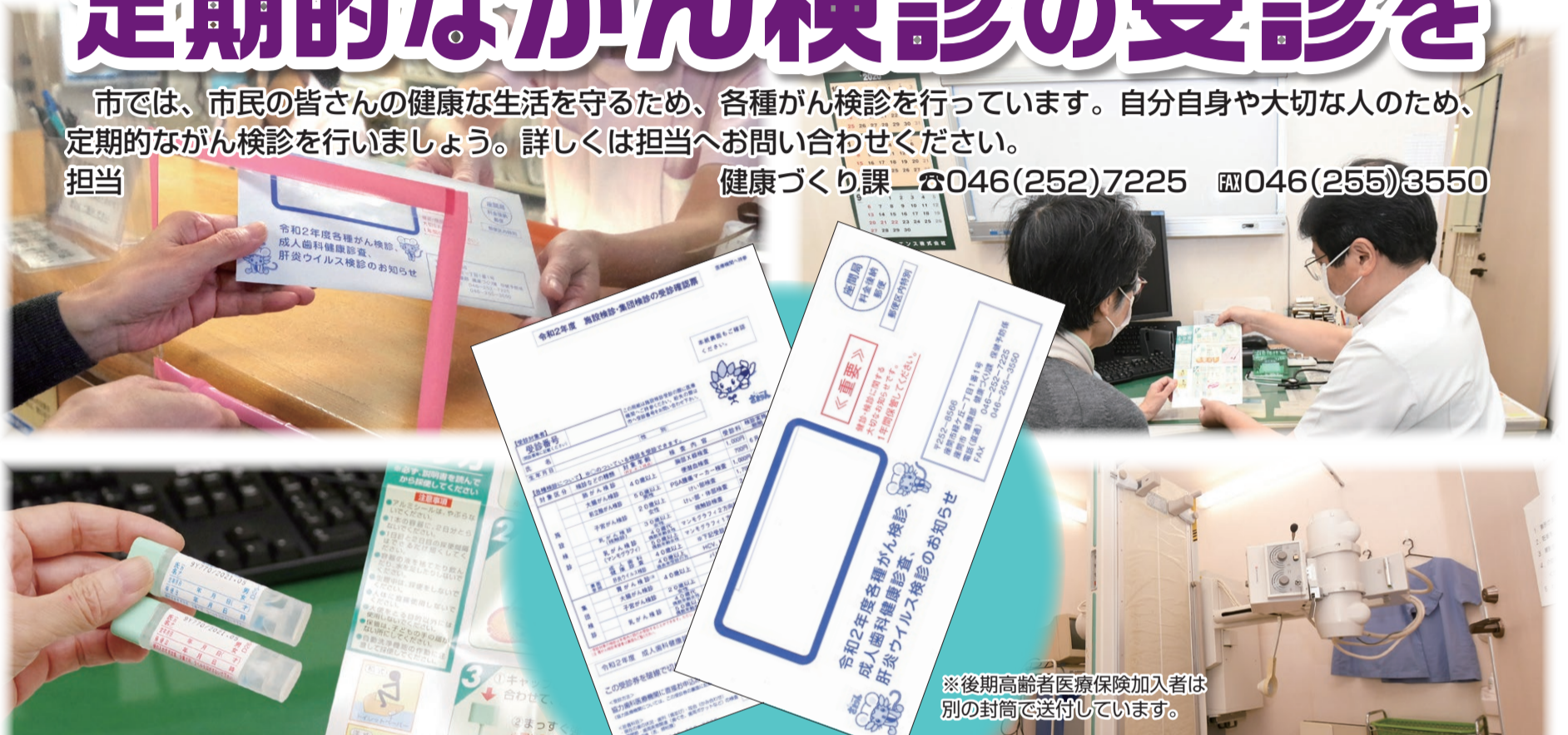
※後期高齢者医療保険加入者は別の封筒で送付しています。