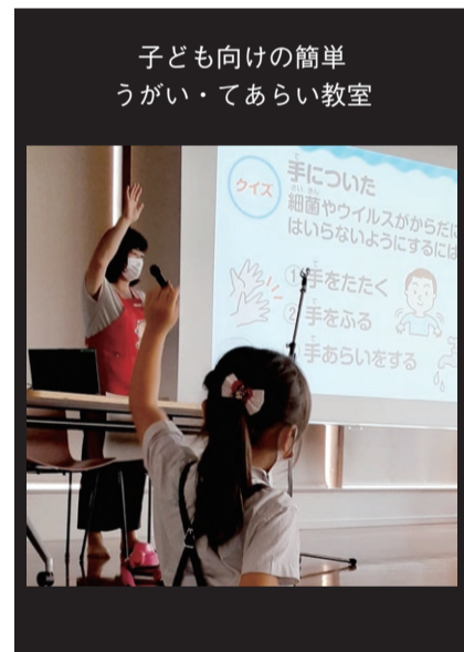
子ども向けの簡単うがい・てあらい教室