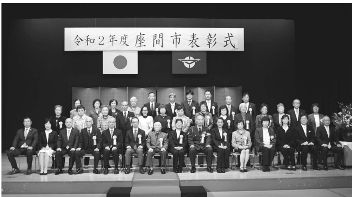
令和2年度座間市表彰式

けましょう。その他、調理の前後、食事前などに小まめに行いましょう。手指に付いたウイルスは、せっけんで丁寧に洗うことでほぼ洗い流すことができます。手洗いをするときには時計や指輪を外し、蛇口やレバーで水を止めるときは手首やペーパータオルを使いまし