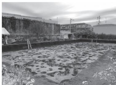
遺跡調査時の様子