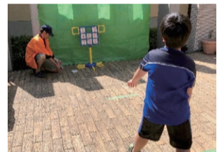
前年度納涼祭でのゲームコーナー

例年8月に開催している納涼祭について、役員会で企画を進めていましたが、新型コロナウイルスの感染防止を考慮すべきとの意見が多く出され、祭りは中止し、代わりにプライベートカードを会員に配ろうという結論に至りました。マスクや除菌グッズなど、各々が予防のために必要とするものを購入して頂いたほうが良いと考えたからです。令和2年11月に全世帯に配布しました。来年度は、自治会の行事が実施出来ることを願っています。