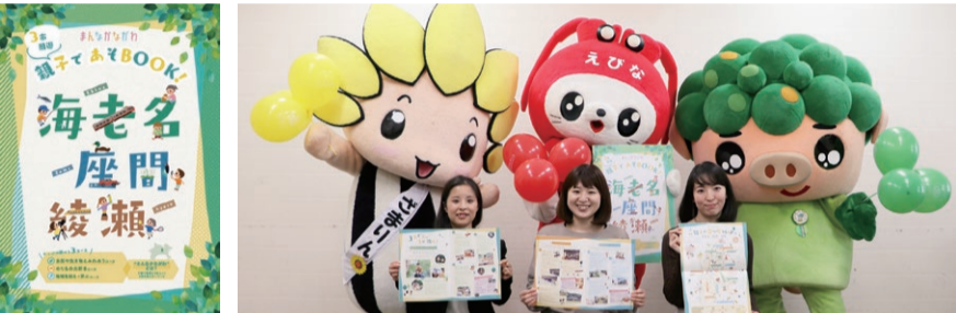
「まんかながわ 親子であそBOOK」と編集担当者