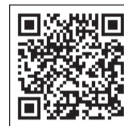
サニープレイス座間