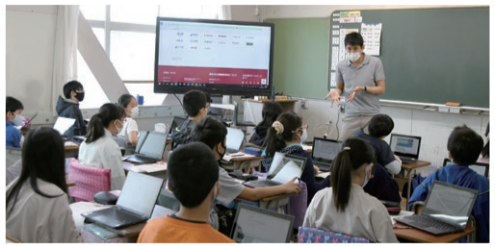
小学校の社会科の授業で活用される学習用端末

今後もスライドを活用したプレゼンテーションを行うなど、児童・生徒の情報化・グローバル化社会に対応できる資質・能力の育成を目指し、より良い教育活動を推進していきます。