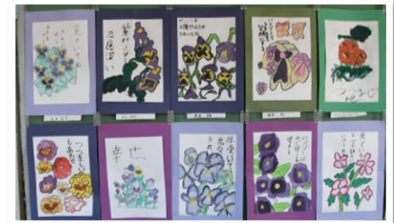
学習用端末の写真機能を活用して描いた絵

希望者への「広報ざま」の戸別配布を実施中 ○新規のお申し込み 申込専用電話 ☎046(252)8684 (市政戦略課) ※新聞を購読されている方には、新聞に折り込まれます。 ○届かない場合 (株)神奈川新聞総合サービス ☎0120(111)429 (無料)