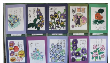
学習用端末の写真機能を活用して描いた絵

希望者への「広報ざま」の戸別配布を実施中 ○新規のお申し込み 申込専用電話 ☎046(252)8684 (市政戦略課) ※新聞を購読されている方には、新聞に折り込まれます。 ○届かない場合 (株)神奈川新聞総合サービス ☎0120(111)429 (無料)