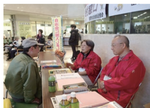
以前の加入促進キャンペーン

地域の安全・安心のためにはより多くの人の協力が必要です。令和2年度はコロナ禍で見合わせましたが、市自連では年度末に自治会への加入に理解を深めていただくため、転入者を対象に市役所で加入促進キャンペーンをしています。また、転入者への働きかけのほかに、会員の皆さんの自治会活動をバックアップすることも大切であり、令和3年度は組織強化のための対応もしていきたいと考えています。