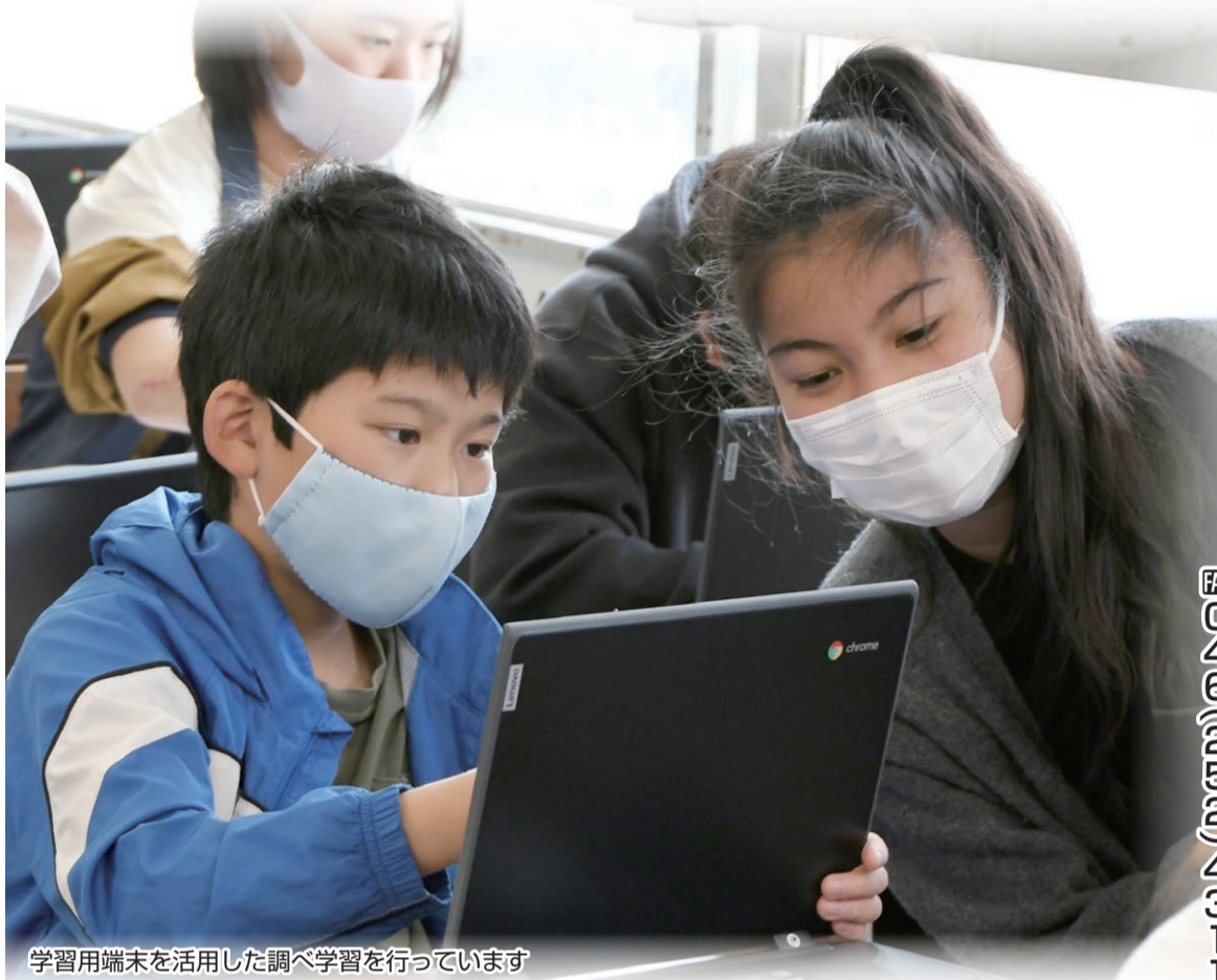
学習用端末を活用した調べ学習を行っています

市教育委員会では、GIGAスクール構想の実現に向け、市内小・中学校の全児童・生徒に1人1台の学習用端末(タブレット)を配備し、教育のさまざまな領域で活用を始めています。 担当 教育研究所 ☎046(252)8460 ☎046(252)4311