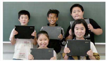
座間市では1人1台学習用端末の導入が完了しています

市教育委員会では、令和2年度までに電子黒板(65インチ)の更新(各クラス)、高速大容量の校内高速LAN整備、1人1台学習用端末の整備などを行ってきました。