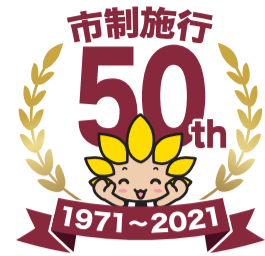
座間市マスコットキャラクター「ざまりん」