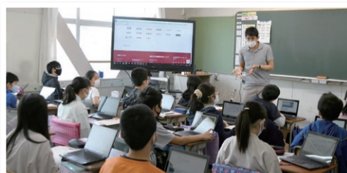
小学校の社会科の授業で活用される学習用端末

今後もスライドを活用したプレゼンテーションを行うなど、児童・生徒の情報化・グローバル化社会に対応できる資質・能力の育成を目指し、より良い教育活動を推進していきます。