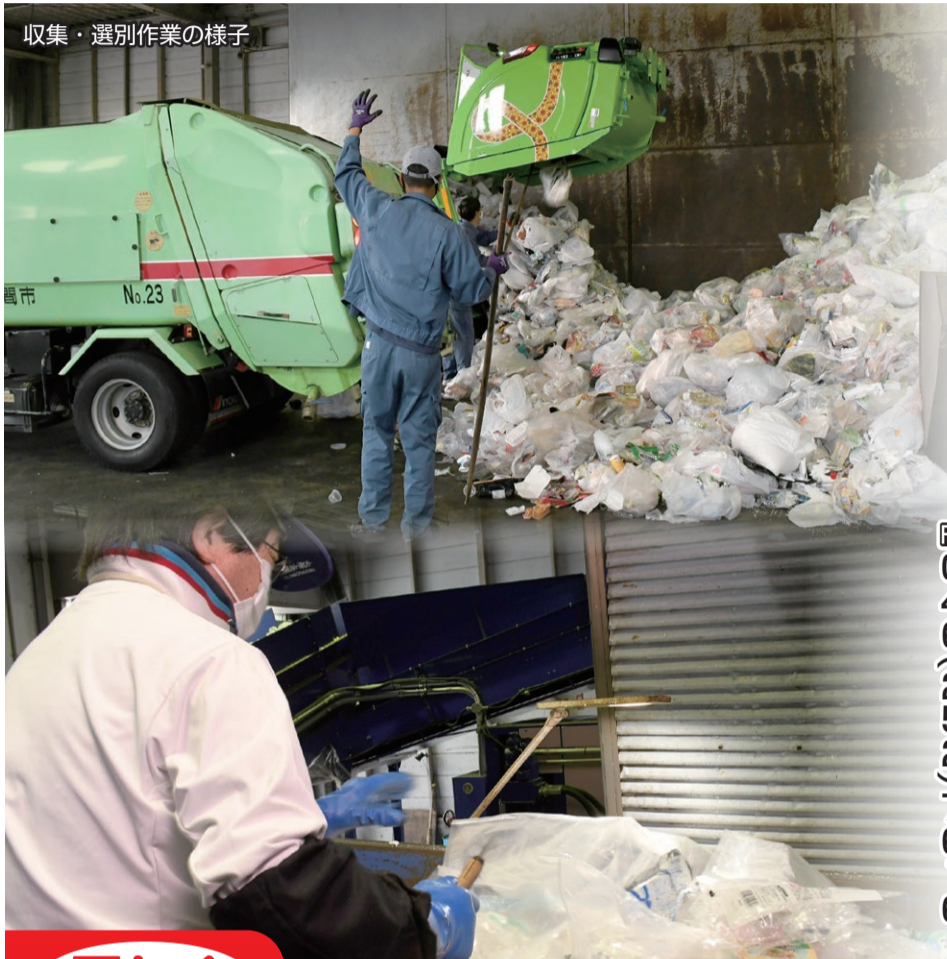
収集・選別作業の様子

市では、ごみを正しく分別することで燃やすごみの減量化に取り組んでいます。新型コロナウイルス感染症の影響により、家庭で過ごす時間が増え、家庭から出るごみが増えています。食べ残しを無くしてごみを減らし、分別を徹底するなどご協力をお願いします。 担当 資源対策課 ☎046(252)7985 FAX 046(252)7616