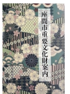
座間市重要文化財案内