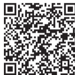
メール申し込み 2次元コード