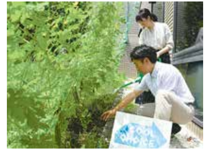
市庁舎のグリーンカーテン