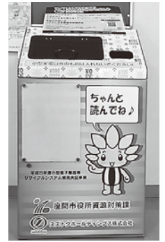
市役所に設置している小型家電回収ボックス

※小型家電（電気シェーバー、デジタルカメラ、携帯ゲーム機など）は必ず電池を抜いてから、指定の小型家電回収ボックス（市役所、クリーンセンター、スカイアリーナ座間、ノジマ座間店に設置）へ。