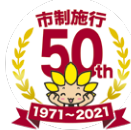
座間市マスコットキャラクター「ざまりん」