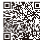
市LINE公式アカウント