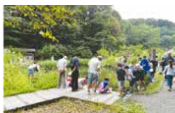
市民レクでのザリガニ釣り

当地区自連は座間駅東側一帯に位置し、県立座間谷戸山公園に隣接した昔ながらの自然が残っているエリアです。住民の多くは座間市に住んで1～2世代の世帯が多いため、コミュニケーションを深めるためにも自治会の役割は大切です。昨年度からコロナ禍のため目立った活動が中断していますが、恵まれた環境を利用した親睦活動ができないかをテーマに、自治会活動を通じてより良い生活環境づくりの一翼を担っていききたいと思います。