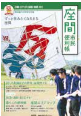
座間市民便利帳表紙

※発行部数に限りがあるため、原則として発行時、転入の手続き時にお渡ししたものの他にお渡しすることはできません。紛失することのないようご注意ください。