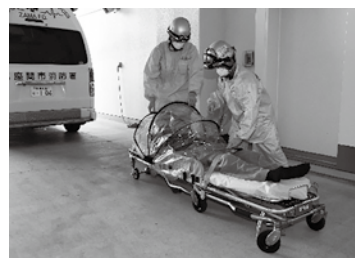
感染症対策訓練の様子

なお、救急活動終了後は救急車内の消毒、使用資器材や装備品の消毒・廃棄を実施し、活動隊員も帰署後に体の洗浄などをして次の出勤に備えています。