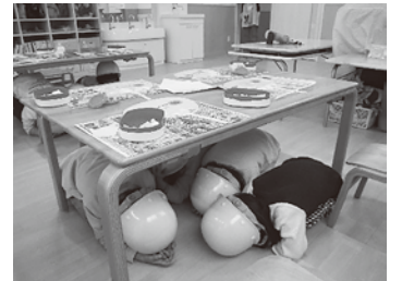
保育園で行った同訓練の様子

都心南部直下型地震（市内最大震度6強）を想定した訓練で毎年1月23日に行っている訓練です。同訓練では地震発生から1分間の「体を守る行動訓練（安全行動1-2-3）」、プラスワン行動訓練を行います。市では、平成24年度からざま災害ボランティアネットワークと共催で同訓練に取り組んでおり、昨年度は市民など54,269人が参加しました。今年度の訓練は令和4年1月23日（日）午前11時（当日参加できない場合は令和4年1月4日（火）～31日（月）の代替期間に実施可）に開催を予定しており、11月1日（月）から参加登録を受け付けます。