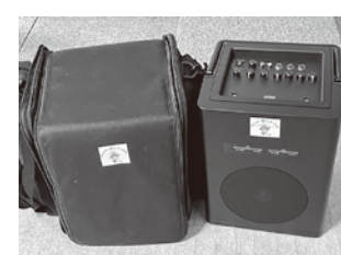
拡声器（右）と収納ケース