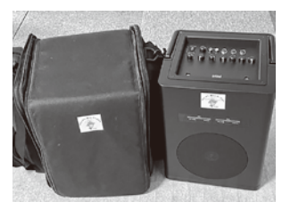
拡声器（右）と収納ケース