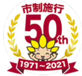
座間市マスコットキャラクター「ざまりん」