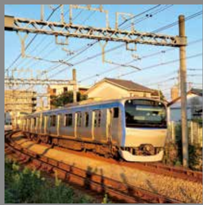
毛利 はなみ 令和3年9月10日撮影 さがみ野