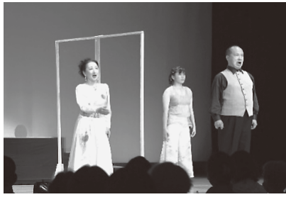
特別記念コンサート第2部

ミニオペラ 古典落語より「寿限無」、新作初演「座間讃歌」〜見えないモノが見える街 座間〜」などの公演が行われました。第2部で公演された「座間讃歌」は、市制施行50