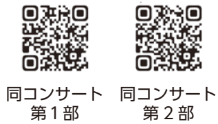
同コンサート 第1部

同団体が作成したコンサート動画が、YouTubeで公開されていますので、次の2次元コードからご覧ください。