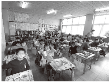
ざまりん給食(中原小学校)

も汁」はいずれも座間市で昔から食べられていた郷土食で、市内の農家が丹精を込めて育てたブランド米「はるみ」や野菜、みそなどをふんだんに使用しています。