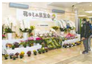
昨年の同展覧会の様子