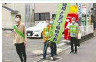
のぼり旗でのパトロール

コロナ禍で役員会の開催にも気を使い、会員同士の交流もままならない中、自治会ののぼり旗をたずさえた安全安心パトロールは続けています。青色回転灯付パトロール車は注目度が高いのですが、3丁目自治会だけでは利用に消極的でした。しかし、この青パト車によるパトロールを地区自連事業としてスタートし、下期から市の所有車を使い各自治会が輪番で毎月実施することになり、相模が丘全域のパトロール強化に繋がっています。