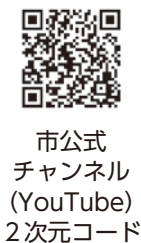
市公式 チャンネル (YouTube) 2次元コード

市では、1月9日に実 施した消防出初式の動画 「Tube」で公開しています。 次のURLまたは2次元コ ードからご覧ください。