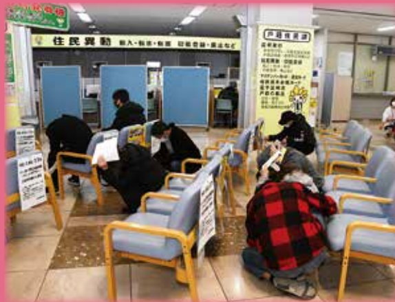
過去のシェイクアウト訓練の様子