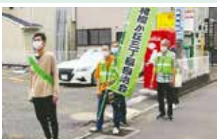
のぼり旗でのパトロール

コロナ禍で役員会の開催にも気を使い、会員同士の交流もままならない中、自治会ののぼり旗をたずさえた安全安心パトロールは続けています。青色回転灯付パトロール車は注目度が高いのですが、3丁目自治会だけでは利用に消極的でした。しかし、この青パト車によるパトロールを地区自連事業としてスタートし、下期から市の所有車を使い各自治会が輪番で毎月実施することになり、相模が丘全域のパトロール強化に繋がっています。