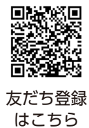
友だち登録はこちら