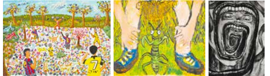
大賞「わたしの幸せ」 (13歳 タイ)